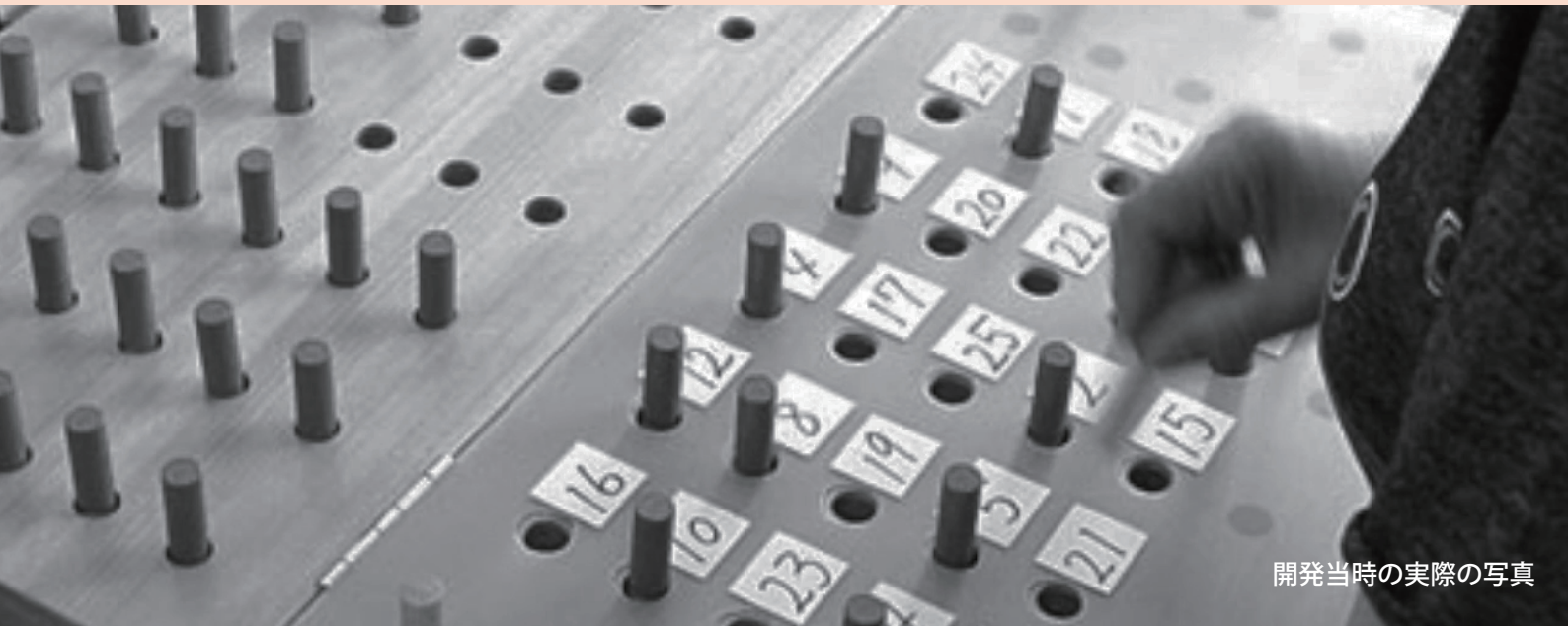
開発当時の実際の写真